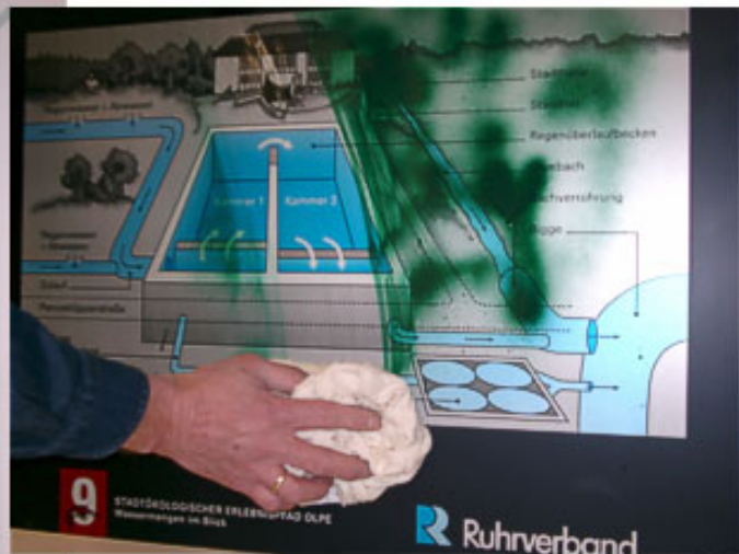
Graffiti können leicht entfernt werden, ohne den Untergrund zu beschädigen.

Weitestgehend feuerfest, sogar bei direkter und anhaltender Einwirkung.