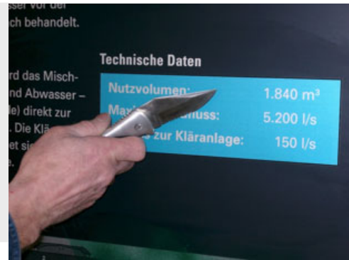
Hohe Kratzfestigkeit für extreme Belastungen.

Dadurch können wir je nach Anforderung gängige Angriffe mit Feuer, Säuren oder scharfkantigen Gegenständen wie Messern o. ä. abwehren.